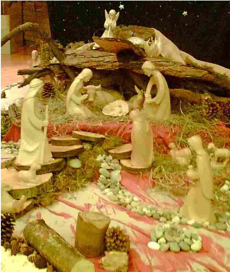
Krippe in St. Franziskus